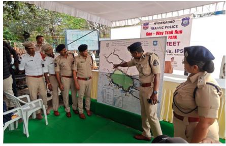
హైదరాబాద్ సురక్ష ప్రతినిధి:

హైదరాబాద్ సీటీ ఇన్స్పెక్టివ్ & ట్రాన్స్పార్టేషన్ ఇన్స్పెక్టర్ (H-CITI) లో భాగంగా బంజారాహిల్స్ మరియు జూబ్లీహిల్స్ ట్రాఫిక్ పోలీస్ స్టేషన్ల పరిధిలో జరుగుతున్న ట్రాఫిక్ మార్గం మరియు అందరవరం నిర్మాణ పనుల దృష్ట్యా ట్రాఫిక్ మళ్లంపులు ఉంటాయి. ఆదివారం ఉదయం 11:00 గంటల నుండి మధ్యాహ్నం 1:00 గంటల మధ్య (1100 HRS TO 1300 HRS) కేబీఆర్ పార్క్ (KBR Park) చుట్టుపక్కల ఉన్న అన్ని రహదారులలో ట్రాఫిక్ ను వన్ వే ట్రయల్ రన్ (ONE WAY TRIAL RUN) గా నిర్వహించడం జరుగుతుంది. ప్రయాణికులు తమ ప్రయాణాన్ని ముందస్తుగా ప్లాన్ చేసుకోవాలని మరియు ఈ క్రింది రోడ్ల మళ్లంపులను ఉపయోగించుకోవాలని, అలాగే వారి ప్రయాణ మార్గాన్ని ప్లాన్ చేసుకోవాలని సూచించడమైనది: NFCL నుండి SNT, సాగర్ సొసైటీ (ముల్ల), KBR పార్క్ ఎంట్రన్స్ & జూబ్లీహిల్స్ చెక్ పోస్ట్, రోడ్ నెం.36, రోడ్ నెం.45 మరియు కేబుల్ బ్రిడ్జి (దుర్గం చెరువు) వైపు వెళ్లే ట్రాఫిక్: ప్రయాణికులు ఇబ్బందులను నివారించడానికి ఈ క్రింది మార్గాన్ని అనుసరించాలని సూచించడమైనది - NTR భవన్ వద్ద ఎడమ మలుపు తీసుకుని బసవతారకం క్యాన్సర్ ఆసుపత్రి వైపు వెళ్లాలి - ఆర్ఎస్ఐ బలాండ్ ద్వారా ప్రయాణించి ఒమ్మగోడ వైపు కొనసాగాలి - అక్కడ నుండి రోడ్ నెం. 45, జూబ్లీహిల్స్ చెక్ పోస్ట్, కేబుల్ బ్రిడ్జి మరియు IKEA వైపు వెళ్లాలి. యూసుఫ్ నగర్, శ్రీనగర్ కాలనీ నుండి రోడ్ నెం. 36 & 45, జూబ్లీహిల్స్, మాదాపూర్ వైపు వెళ్లే ట్రాఫిక్: ప్రయాణికులు సాఫీగా మరియు సాకర్వంతమైన ప్రయాణం కోసం ఈ క్రింది మార్గాన్ని అనుసరించాలని సూచించడమైనది - ఇందిరానగర్ గడ్డ రోడ్ (రోడ్ నెం.5, జూబ్లీహిల్స్) ద్వారా వెంకటగిరి జంక్షన్ వైపు వెళ్లాలి - వెంకటగిరి జంక్షన్ వద్ద కుడి మలుపు తీసుకోవాలి -