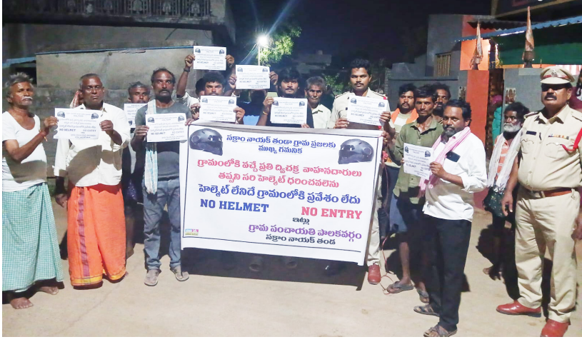
మహబూబాబాద్ జిల్లా సురక్ష ప్రతినిధి: