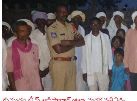
ముసురం భీమ్ ఆసిసాబాద్ జిల్లా సురక్ష ప్రతినిధి:

గుడుంబా తయారీ, విక్రయాలు నేరమని, ఇందులో పాల్గొంటే కఠిన చర్యలు తప్పవని హెచ్చరించారు. గంజాయి వినియోగం, రవాణా, విక్రయాలపై కూడా చట్టపరమైన చర్యలు తీసుకుంటామని తెలిపారు. రోడ్డు ప్రమాదాలు నివారించేందుకు హెల్మెట్ ధరించడం, మద్యం సేవించి వాహనం నడపకూడదని, ట్రాఫిక్ నిబంధనలు పాటించాలని సూచించారు. కార్యక్రమంలో గ్రామస్థులు, యువకులు పాల్గొన్నారు.