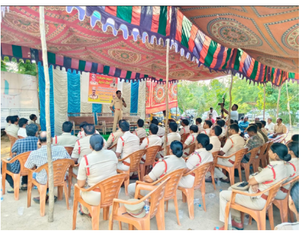
రామగుండం పోలీస్ కమిషనరేట్ సురక్ష ప్రతినిధి:

క్యాతనపల్లి మున్సిపాలిటీలో చైర్మన్ మరియు వైస్ చైర్మన్ల ఎన్నికల సందర్భంగా శాంతి భద్రతలను కాపాడేందుకు కట్టుదిట్టమైన బండబిస్తు ఏర్పాటు చేయబడ్డాయి. ఈ సందర్భంగా బండబిస్తు కోసం ఏసీపీ-04, సీఐ-23, ఎస్ఐ-46, ఎఎస్ఐ/హెడ్ కానిస్టేబుల్-98, పోలీస్ కానిస్టేబుల్-167, మహిళా పోలీస్ సిబ్బంది-49, స్పెషల్ వార్డ్ సిబ్బంది-38, హో గార్డ్స్-60, మొత్తం 485 మంది సిబ్బంది, అలాగే 4